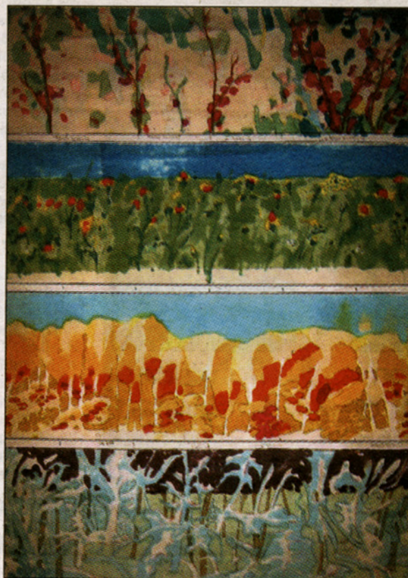
Les esquisses originales des murales de la station Snowdon.